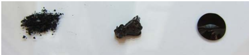
Variable Konsistenz der Nanopartikel-Oleinsäure-Dispersion durch Anpassung der Partikel-Konzentration (links: Pulver mit 90% NP, Mitte: Paste mit 50% NP, rechts: Öl mit 25% NP).

Mit Hilfe dieser speziellen Nanopartikel ist es bspw. möglich, Schichten mit entsprechenden Funktionen, wie bspw. einer antibakteriellen Wirkung, auszustatten. Aufgrund der magnetischen Eigenschaften der Partikel können diese während der Schichterzeugung mit Magnetfeldern regional konzentriert werden. Die Konsistenz der Partikel-dispersion ist konzentrationsabhängig einstellbar von Pulver über Paste (einsetzbar für Polymerkomposite) bis hin zu einem Öl (einsetzbar fürs Drucken).