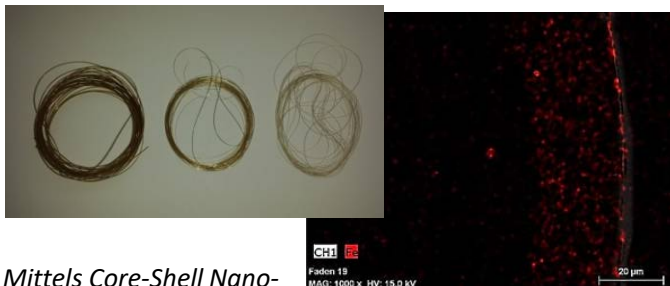
Mittels Core-Shell Nanopartikel oberflächenmodifizierte Polypropylen-Fasern (links). Erhöhte Konzentration der Partikel an der Faseroberfläche nach einer Magnetfeldbehandlung (EDX-Aufnahme)