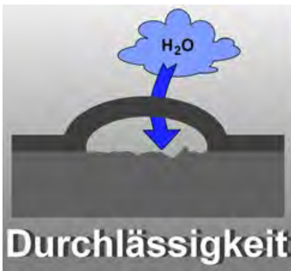
Abbildung 2: Schematische Darstellung der Blasenbildung