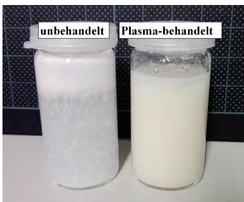
Abbildung 2: Darstellung der verbesserten Dispergierbarkeit eines Polymer (PEEK) –Pulvers in Folge einer Plasmabehandlung in Wasser