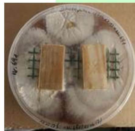
Holzschutzprüfung nach DIN EN 113

In solchen und ähnlich gelagerten Fällen, kann es sinnvoll sein, Materialien mit einer Funktion gegen die Besiedlung mit bestimmten Mikroorganismen auszustatten.