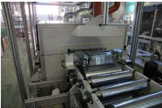
Sol-Gel-Laboranlage bei INNOVENT e.V.

Zudem besteht die Möglichkeit der Entwicklung neuer Sole, welche auf spezielle Anforderungen zugeschnitten sind.