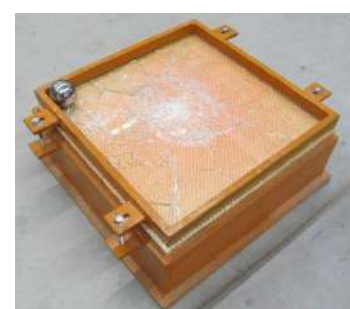
Kugelfalltest an einer Glasscheibe mit Pulverlack und Glasfasergewebe zum Nachweis der Bruchsicherheit