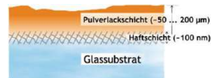
Aufbau der Glas/Pulverlackverbindung unter Verwendung der entwickelten Oberflächenvorbehandlung

Proben Mitte und unten: Pyrosil®+Primer, RAL 9016