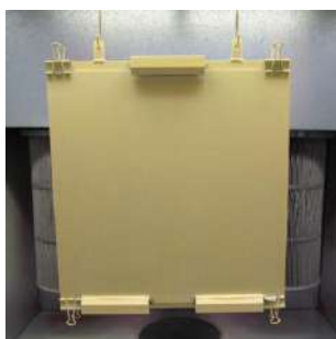
Vertikale Beschichtung von Glasoberflächen mit Pulverlack