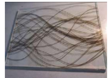
ZIM Kooperationsprojekt mit Firma Lohnitz glas + spiegel KG: ZF 40286067TA5 „Haftvermittlerschichten und aktive Randabdichtungen für Basaltfaser-Verbund-Optik-Bauteile“