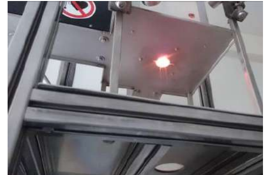
Faserziehturm, TU Freiberg

Antibakterielle und antifouling Wirkung von Basalt wurde durch „Hörensagen“ und Beobachtungen in der Natur (Gleisbetten, Steinbrüche etc.) und vermeintlich verminderten Bewuchs von Oberflächen beschrieben. Bislang gab es keine wissenschaftlichen Untersuchungen zu diesen Sachverhalten, lediglich ein Patent für Hochseeanwendung für Basaltfasern, welches einen verminderten Bewuchs beschreibt, jedoch kein Wirkprinzip. INNOVENT hat diese grundsätzlichen Untersuchungen zu diesem Sachverhalt und Nutzung von eventuell vorhanden Effekten durchgeführt.