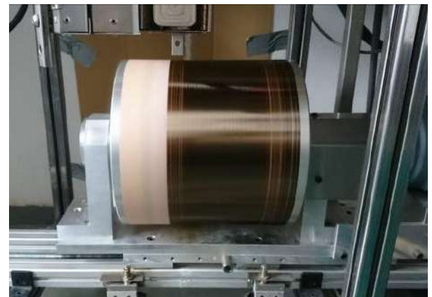
Fasertrommel, TU Freiberg