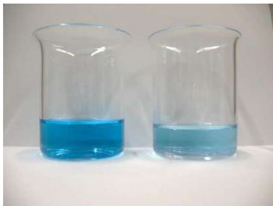
Methyleneblaulösung vor (links) und nach 3h UV-Bestrahlung (rechts)

Die Untersuchung der photokatalytischen Aktivität erfolgte anhand des Abbaus von Methyleneblaulösung entsprechend DIN 52980.