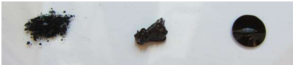
Variable Konsistenz der Nanopartikel-Oleinsäure-Dispersion durch Anpassung der Partikel-Konzentration (links: Pulver mit 90% NP, Mitte: Paste mit 50% NP, rechts: Öl mit 25% NP).

Mit Hilfe dieser speziellen Nanopartikel ist es bspw. möglich, Schichten mit entsprechenden Funktionen, wie bspw. einer antibakteriellen Wirkung, auszustatten. Aufgrund der magnetischen Eigenschaften der Partikel können diese während der Schichterzeugung mit Magnetfeldern regional konzentriert werden. Die Konsistenz der Partikel-dispersion ist konzentrationsabhängig einstellbar von Pulver über Paste (einsetzbar für Polymerkomposite) bis hin zu einem Öl (einsetzbar fürs Drucken).