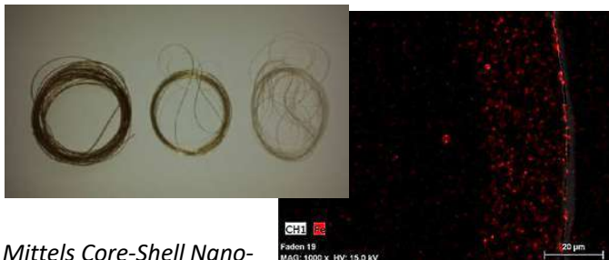
Mittels Core-Shell Nanopartikel oberflächenmodifizierte Polypropylen-Fasern (links). Erhöhte Konzentration der Partikel an der Faser Oberfläche nach einer Magnetfeldbehandlung (EDX-Aufnahme)